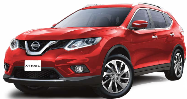
Fotografías y equipamiento correspondientes al grado Exclusive