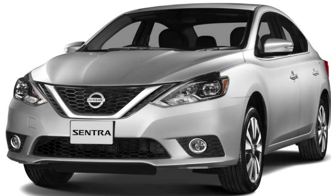
Fotografías y equipamiento correspondientes al grado Exclusive