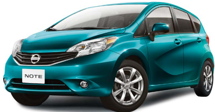
Fotografías y equipamiento correspondientes al grado Advance